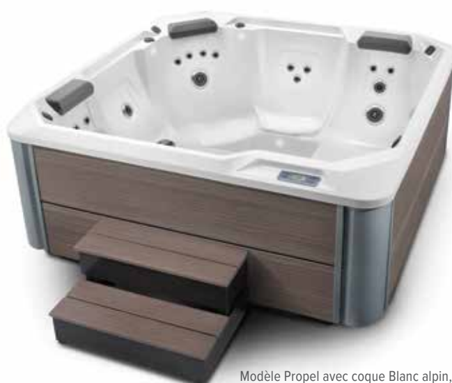
Modèle Propel avec coque Blanc alpin, habillage Havana et marche de la collection Hot Spot Havana.